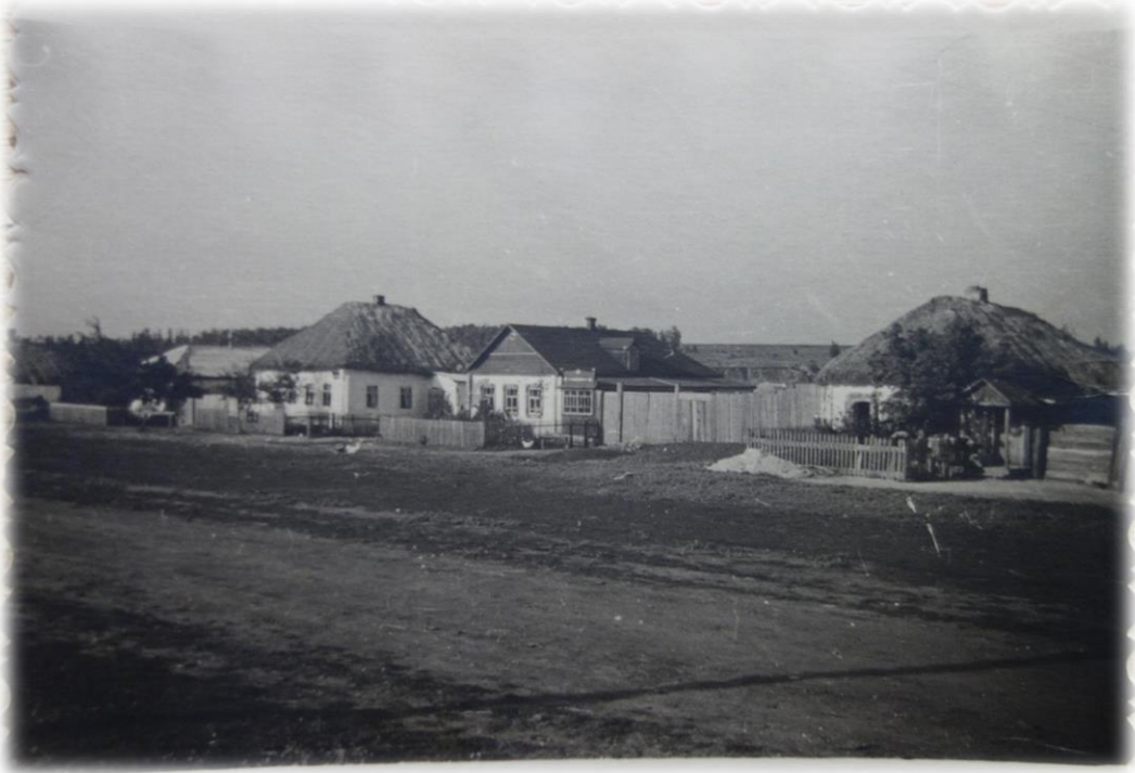
Фотография 2. Село Ивня. Улица Интернациональная