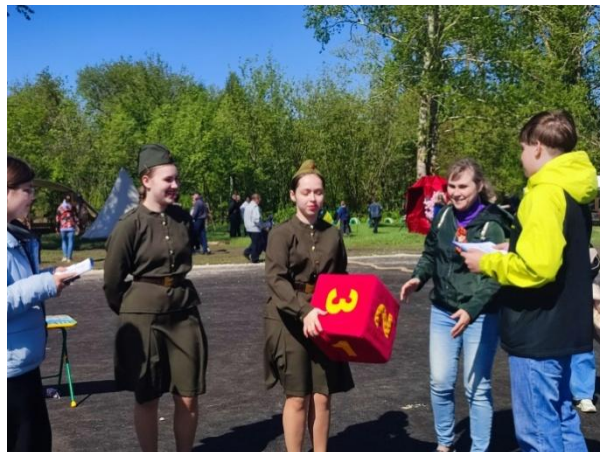
Проведение викторины, посвященной 80-летию Победы в Великой Отечественной войне