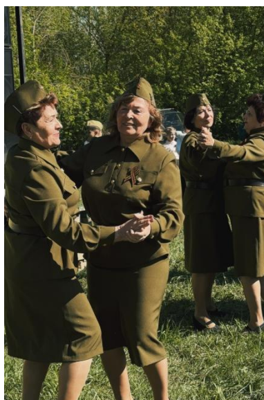
Танцы под песни военных лет