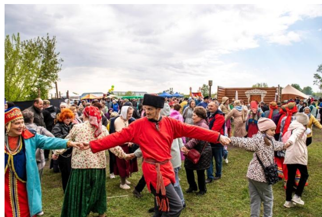
Гости фестиваля пустились в пляс с артистами