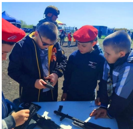
На интерактивной площадке ЦСП «Варяг»