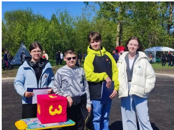
Команда школы №26 города Пензы имени В.С. Гризодубовой на III Всероссийском фестивале Пасхальные истории Спицина Хутора»

https://vk.com/bookmarks?w=wall-186506259_8013