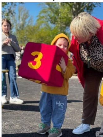
Проведение викторины посвященная 80-летию Победы в Великой Отечественной войне