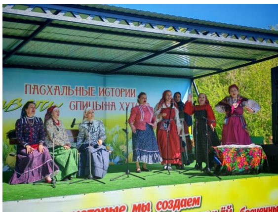
Выступление творческого клуба «Отрада» г. Саратов