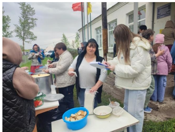
Работа жителей села Григорьевка в гастрозоне