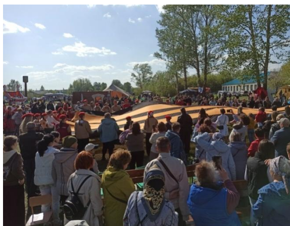
Вынос 15-метровой Георгиевской ленты