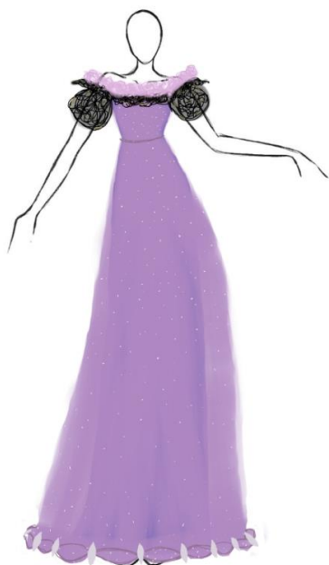
Рисунок 3 – эскиз платья