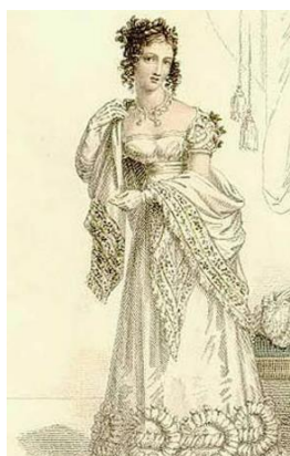
Рисунок 2 – женский наряд