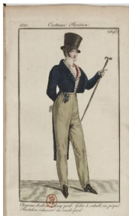
Рисунок 1 – мужской костюм