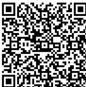
Рисунок 1. Ссылка на опрос

На последнем блоке мы разместили QR-код с ссылкой на опрос, в котором предлагаем оставить отзыв о портале и видеоэкскурсиях.