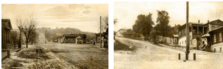
Улица Дворянская (Красная)

Именно в свой первый приезд Маяковский встретился с маленькой девочкой – Татьяной Яковлевой, к которой в будущем испытывал глубокие чувства.