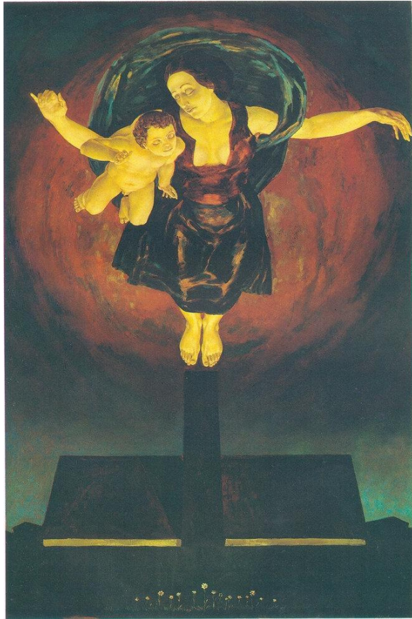
Картина М.А. Савицкого «Мадонна Биркенау», 1978 г.