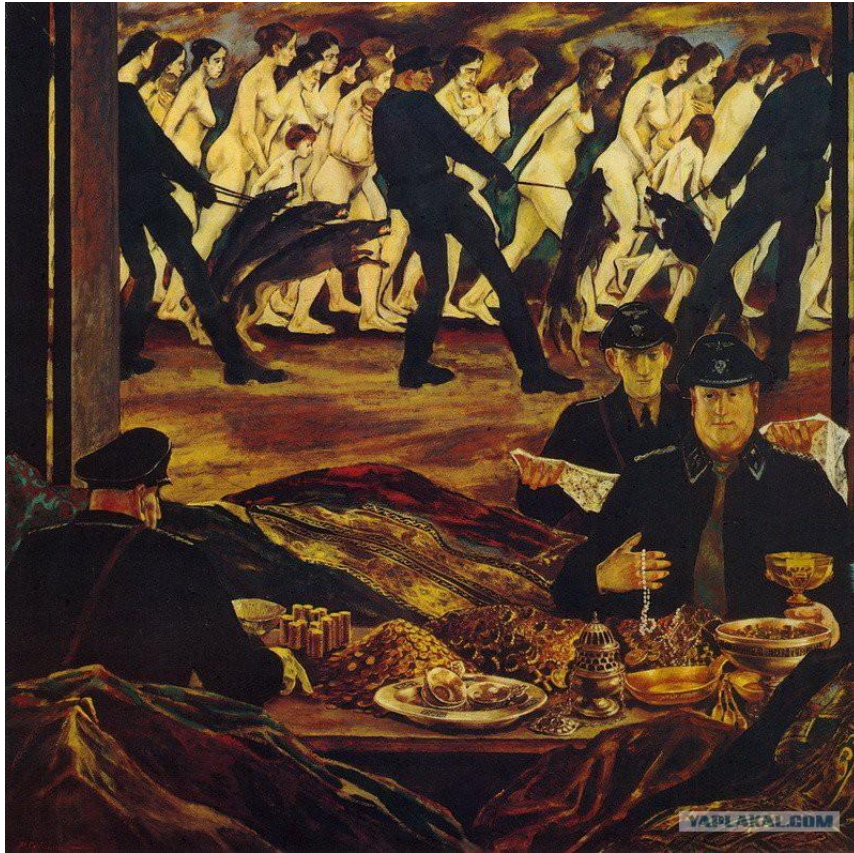
Картина М.А. Савицкого «Канада», 1978 г.