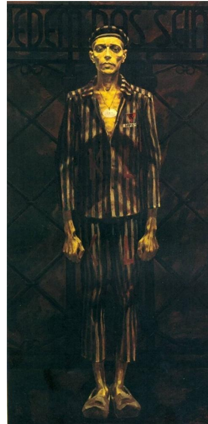
Картина М.А. Савицкого «Узник 32815», 1976 г.