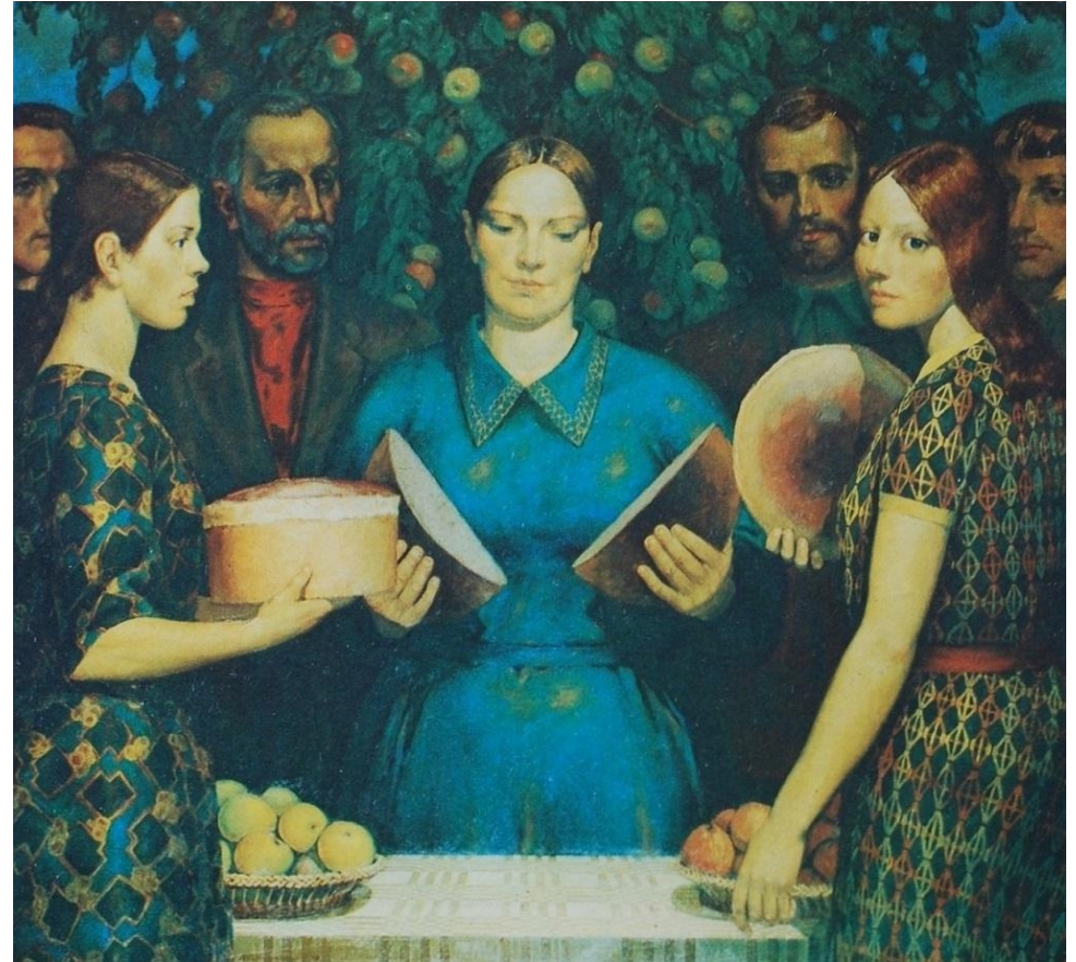
Картина М.А. Савицкого «Хлеб нового урожая», 1979 г.