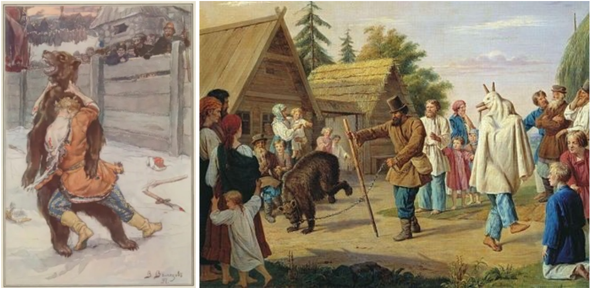
рис.4 - Медведи в жизни деревенского народа