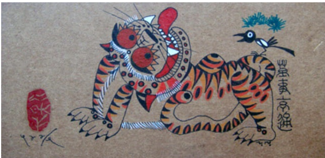
рис.2 - Тигр, отгоняющий духов