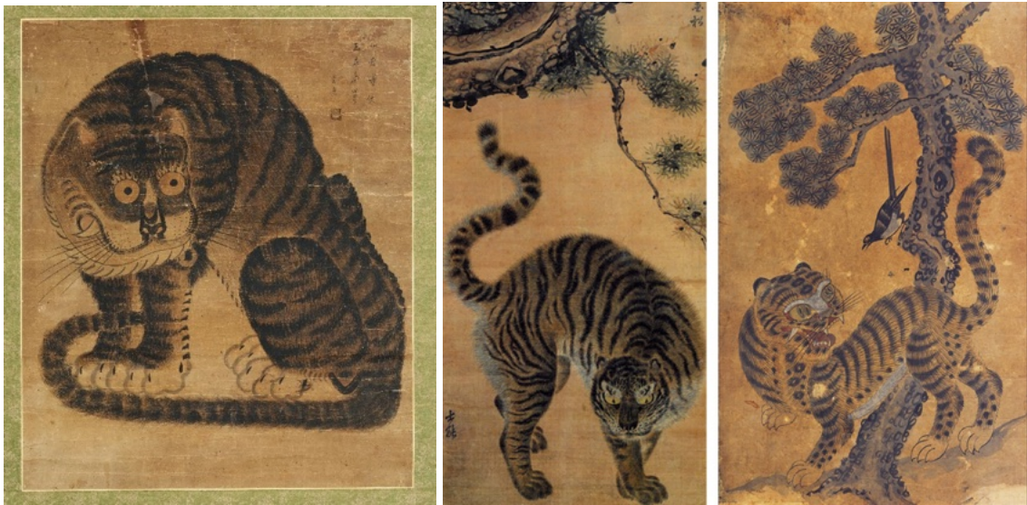
рис.1 - Тигр в корейской живописи