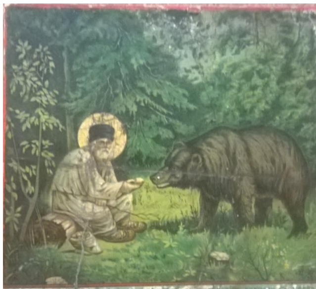
рис. 2.2 Иконопись, Преподобный Серафим Саровский, кормящий медведя

В иконографии и символике русского народа медведь ассоциируется с крепостью духа и мудростью предков. В легендах он часто выступает помощником человека, приносящим спокойствие и уверенность, разделяющим тяготы бытия [11]. (рис 2.2)