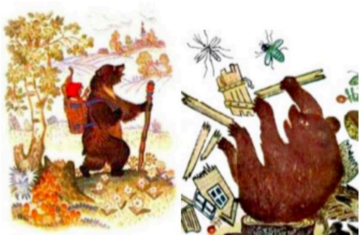
рис.2 - Медведь в иллюстрациях