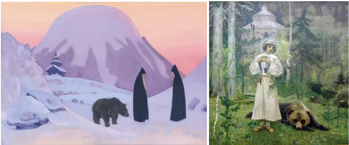
рис.3 - Образ медведя в иконописи и христианской культуре