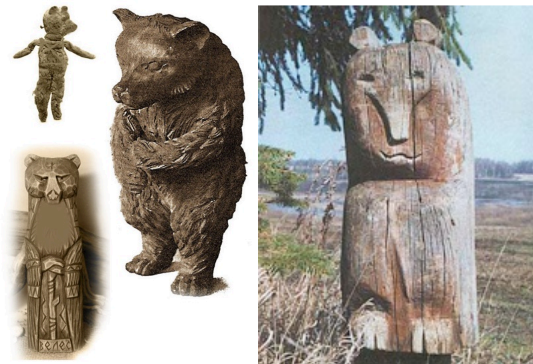
рис.3 - Медведь в прикладном искусстве славян в виде игрушек, идолов