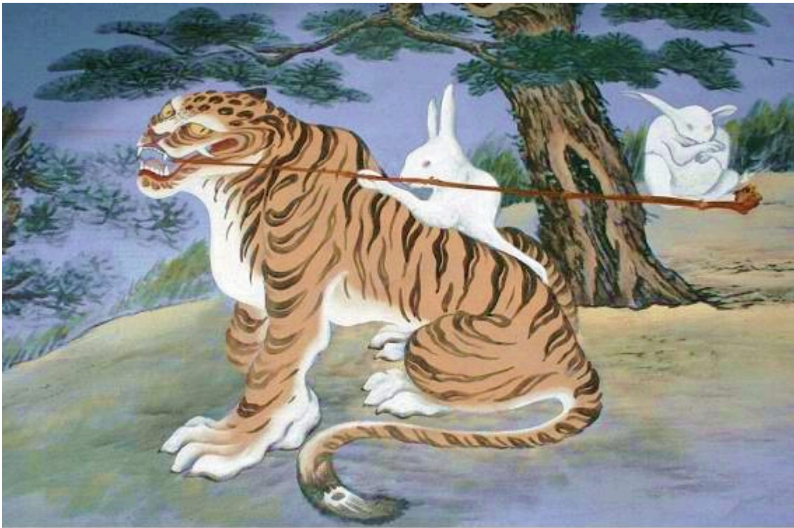
рис.3 - Традиционный сюжет “Тигр курит трубку”