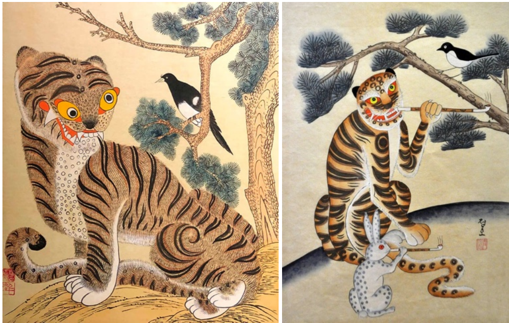
рис. 2.1 Традиционный образ тигра в корейской живописи

Часто тигр изображен курящим трубку. Выражение «Когда тигры курили трубку» в корейском языке используется перед началом рассказа народных сказок или басен и указывает на то, что действие происходит в далеком прошлом и оно вымышлено [12].