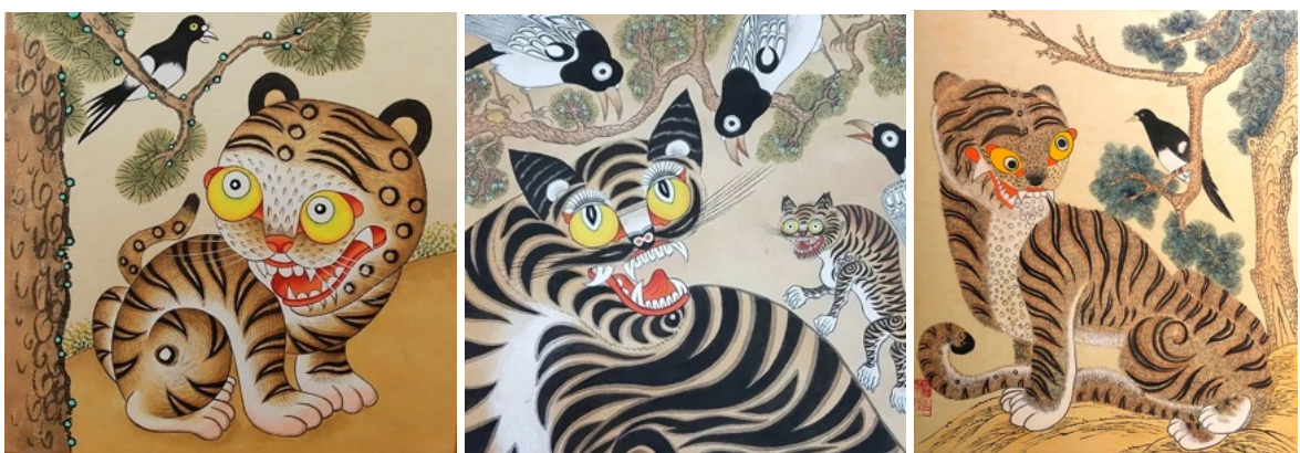
рис.3 - Традиционный сюжет “Тигр, сосна и сорока”