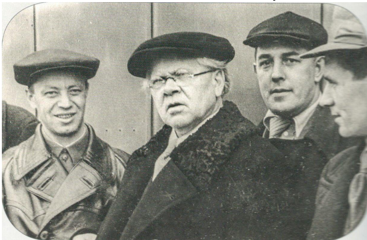
Приложение №3. Фото одной из встреч с пензенскими читателями в 1941 г.