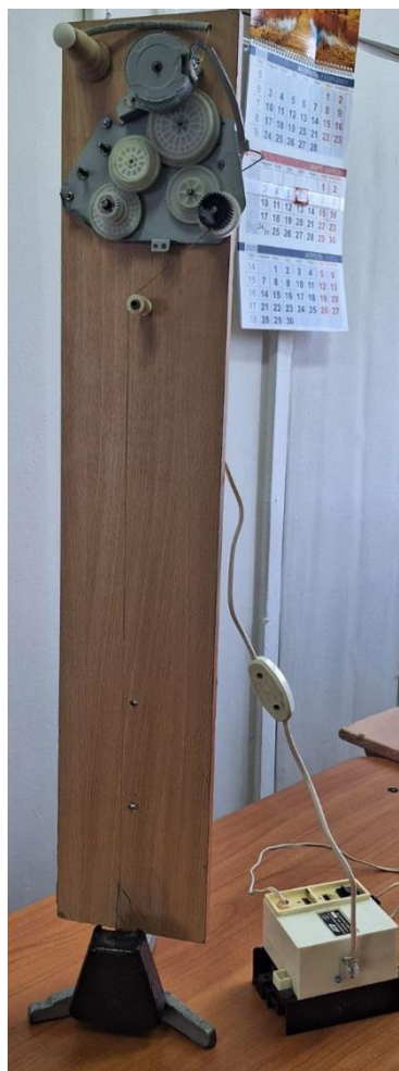
Рис. 5. Гравитационный накопитель энергии