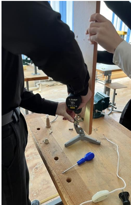
Рис. 4. Этапы сборки гравитационного накопителя энергии