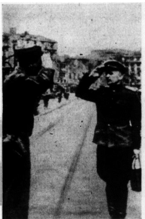
A Russian officer (right) returns the salute of one of our Army photographers as they meet in the Potsdamer Platz sector.

Отрывок из знаменитой речи Уинстона Черчилля 8 мая 1945 года: