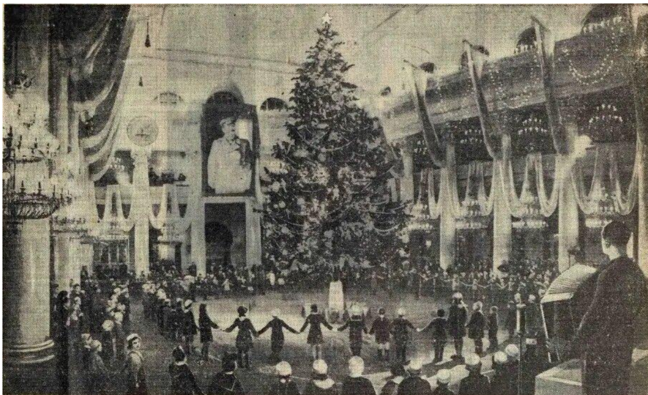
Новогодняя елка в Колонном зале Дома союзов.