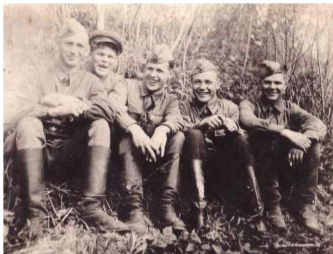
июнь 1942 г. Волоколамск д. Порохово