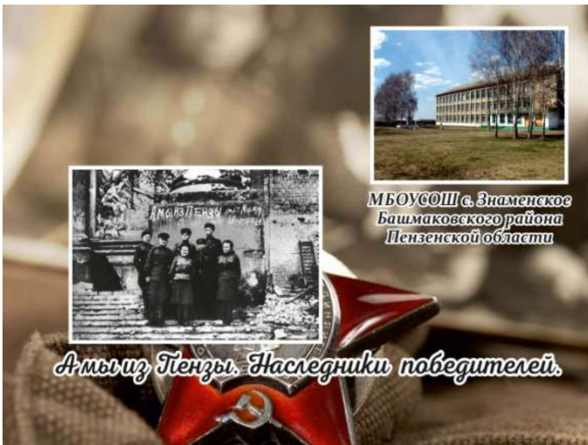
МБОУСОШ с. Знаменское Башмаковского района Пензенской области