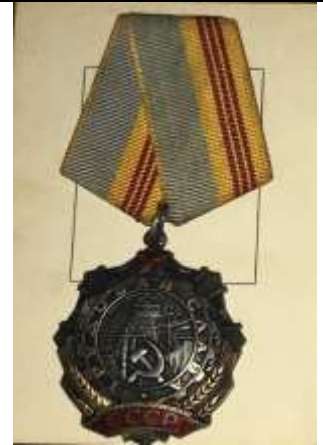
Орден Трудовой Славы III степени