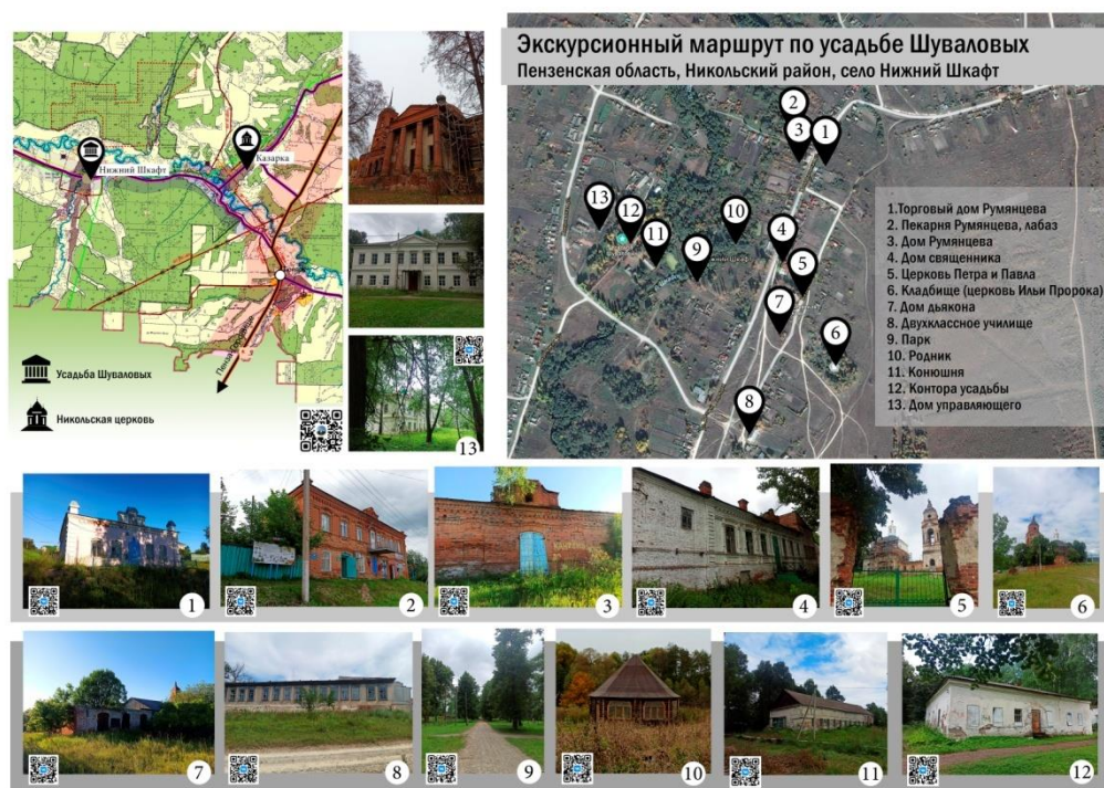
Рисунок 1. Туристско-экскурсионный маршрут "Усадьба Шуваловых"

Хочется верить, что разработанный нами туристско-экскурсионный маршрут "Усадьба Шуваловых" повысит интерес к сохранению усадебной культуры не только в области, но и в стране.