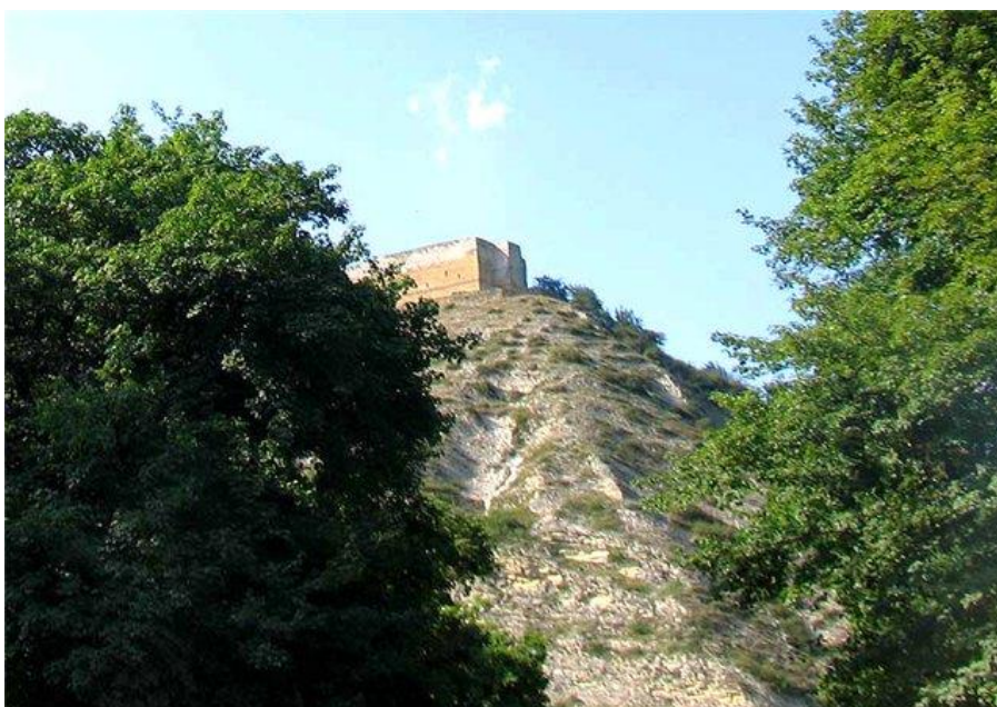
5. Крепость Нарын-Кала(Дербентская крепость)