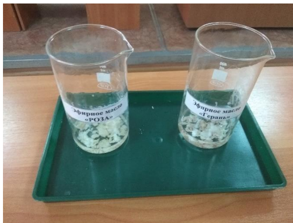
в) растворение в этиловом спирте