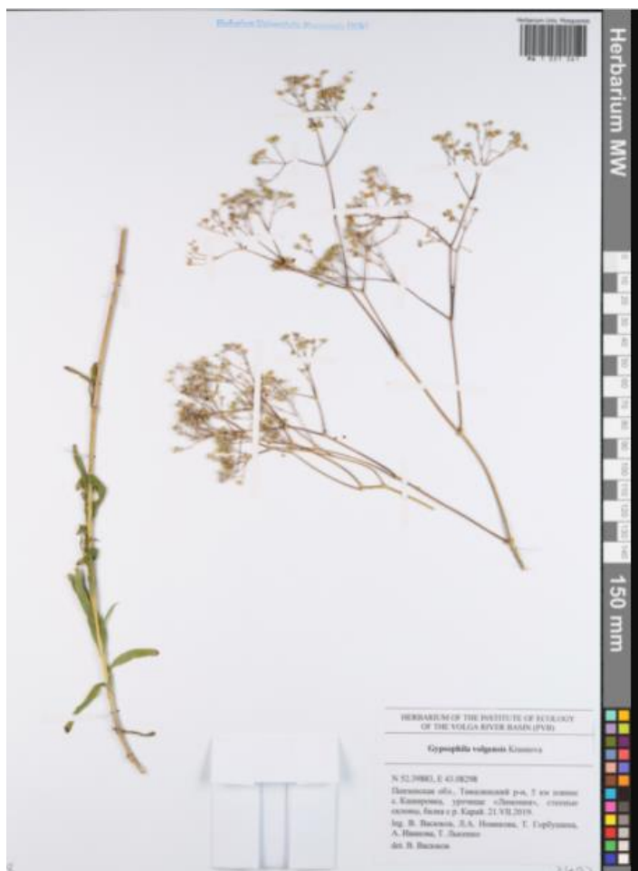
Рис. 2 Гербарный образец депозитария живых систем «Ноев ковчег», МГУ, Москва.

которого следует, что в оцифрованном формате базы хранится всего один образец качима высочайшего, собранного на территории Пензенской области. Растение было собрано, совсем недавно, в 2019 г., на юге Пензенской области в Тамалинском районе, в 5-ти км южнее с. Кашировка, урочище «Лимония», на степных склонах балки реки Карай. Нужно отметить, что ранее в этом районе вид не отмечался [1].