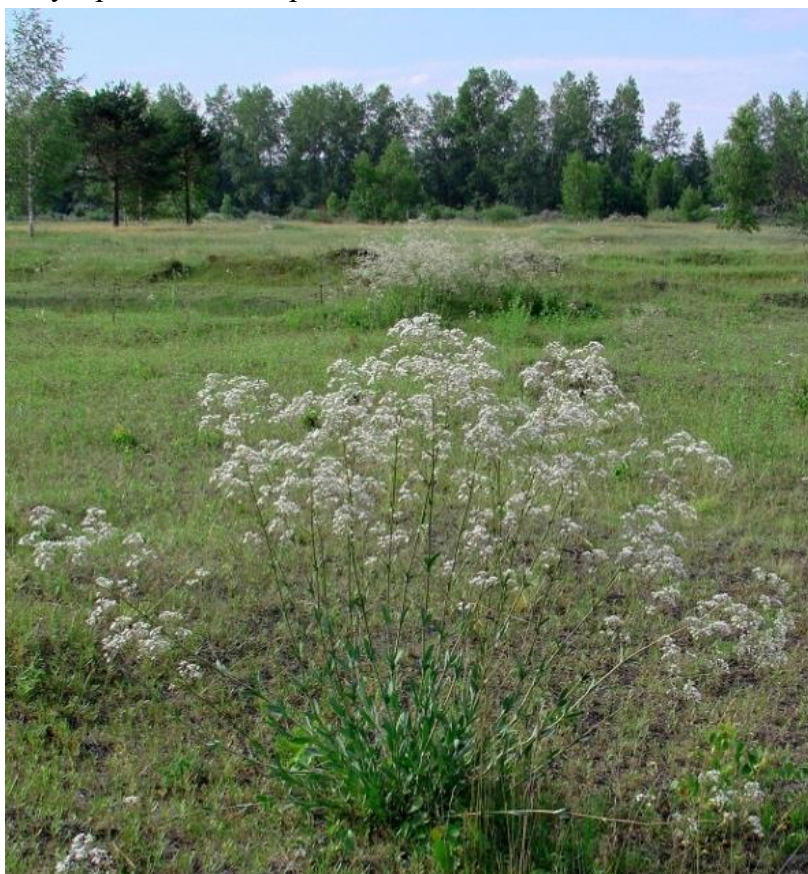
Рисунок 1. Качим высочайший ( Gypsophila altissima L.)

Плод – шаровидная коробочка, 2–2,5 мм в диаметре, длиной 1–1,25 мм, с острыми бугорками на поверхности[4,5,7].