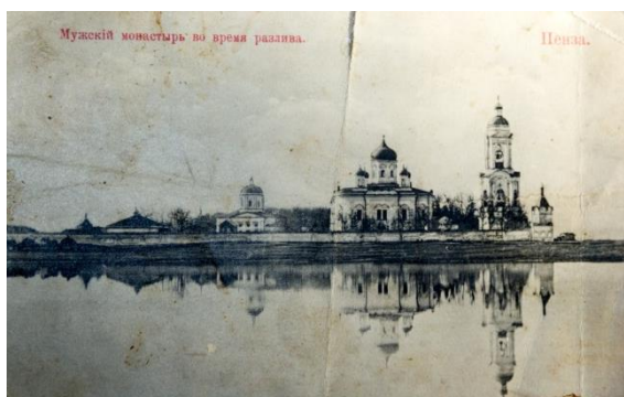
Фото № 5. Спасо-Преображенский мужской монастырь "Новый Спаситель"