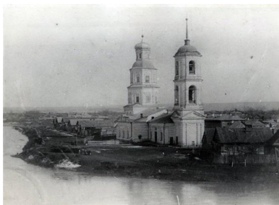
Фото № 3. Петропавловская церковь.