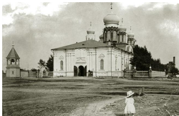
Фото № 6. Богоявленская церковь