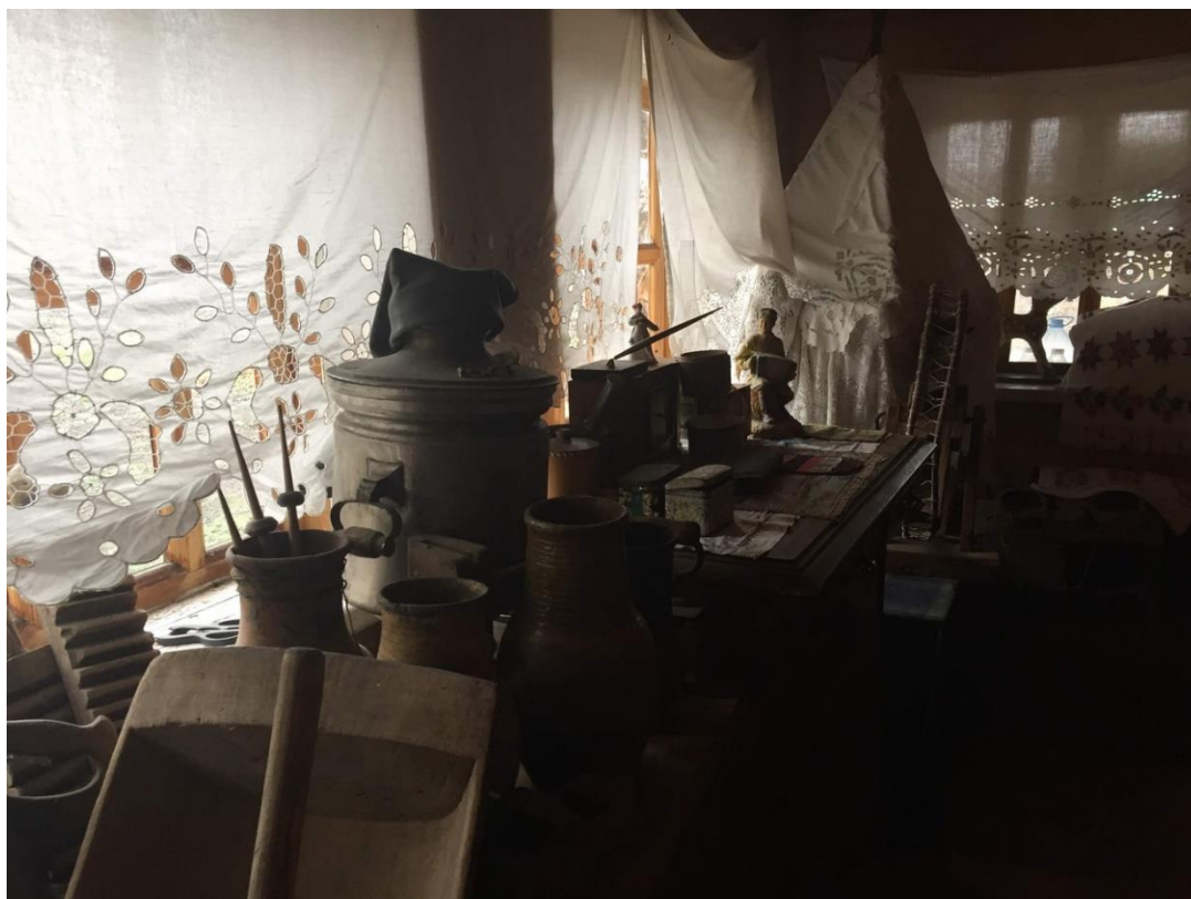
Фото 5. Экспонаты частного музея села Филатовой Н.В.

В частном музее Филатовой Наталья Владимировны сохранились многие вещи, которыми пользовались жители села 100 и более лет назад. Это люльки (укачивать маленьких детей), самовар (1896 года), ступка с пестом, глиняные кувшины, прялки, веретена, рубель (деревянная доска с вырубленными поперечными желобками для катания белья), самотканые сарафаны и рубашки и много другого. (фото 5).