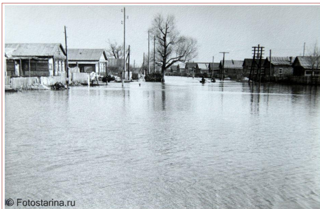
Фото 1. Половодье на реке Пенза в Терновке в 60-ые годы.

Село(микрорайон) Терновка расположено в южной части города Пензы, в долине реки Пенза, левого притока р. Сура. Общий характер рельефа - равнинный, слегка всхолмленный, с незначительными перепадами высот, что является благоприятным условием для заселения и освоения в прошлом. Микрорельеф - равнинные участки, бугры и овраги, остатки действия талых вод и дождевых потоков. Почвы села представлены чернозёмами. Климатические показатели характеризуют климат как умеренно-континентальный. Вдоль села протекает река Пенза. Во время половодья в 60 годы прошлого века заливалась большая часть села. (фото 1)