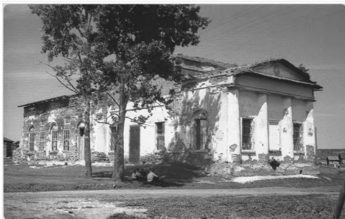
Пригородная деревня Терновка, 1950 год. Здесь была церковь, а скоро будет кинотеатр.

В 1847 году взамен деревянного был построен храм во имя Николая Чудотворца. В 1877 году имелись церковь, школа, входило в состав Валяевской волости. В 1955 году там находился кинотеатр. Церковь восстановлена в середине 90-ых годов. (фото 3 и 4).