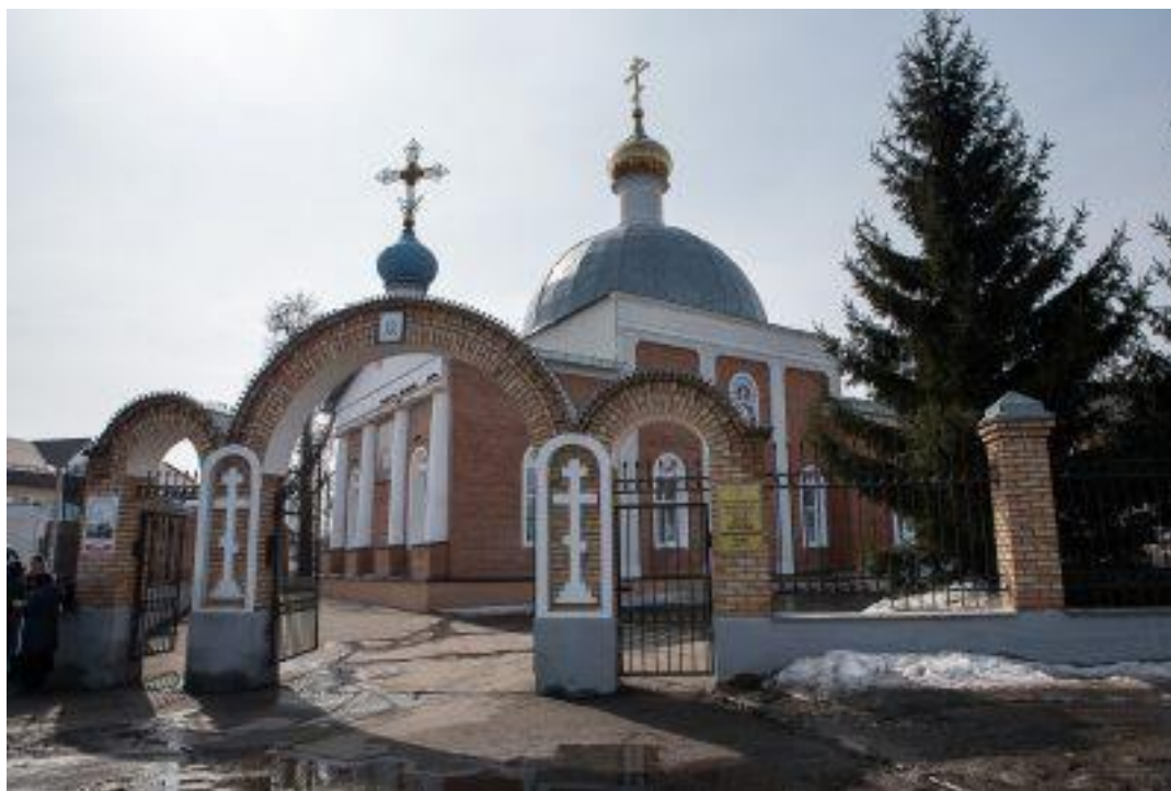
Фото 4. Церковь села Терновки.