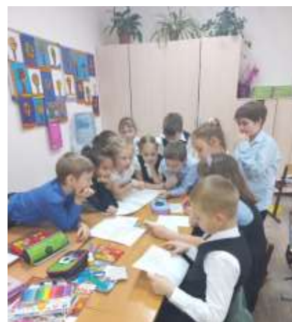
Ученики 3 «Б» класса обсуждают сказочных персонажей.