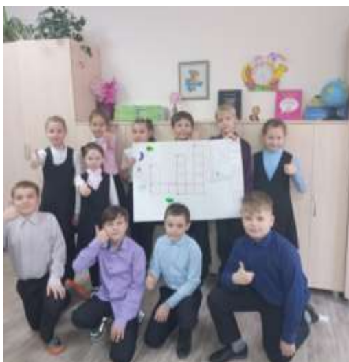
Ребята сделали кроссворд по сказке «Волшебник Изумрудного города».