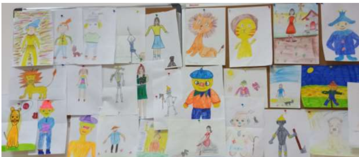
Рисунки персонажей сказки «Волшебник изумрудного города» учеников 3 «Б» класса.