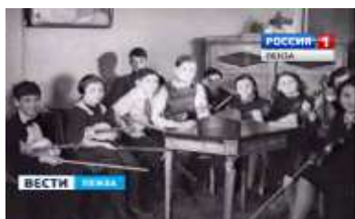
Культурная жизнь детей