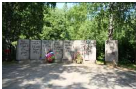
«Цветок жизни»(Ленинградская обл)