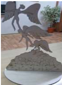
Макет памятника Детям войны