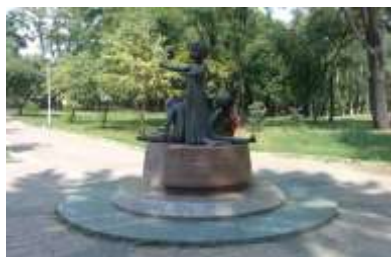
Памятник расстрелянным детям в Бабьем Яру, Киев, Украина Белоруссия