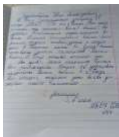
Обращение учащихся 3 в класса МБОУ СОШ №47 г. Пензы к губернатору Пензенской области Белозерцеву И.А( 2020г)

Мы обращались к губернатору Пензенской области с просьбой об установке памятника «Детям войны» в г. Пензе. К сожалению, ответа не поступило.