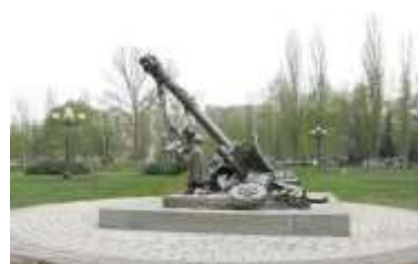
Памятник детям войны в г. Старый Оскол