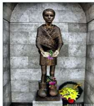
«Тане Савичевой и детям войны»(Новгородская обл)