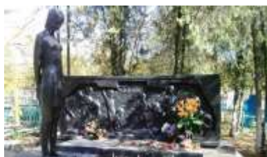
Памятник в г. Ейске