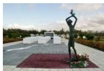
Мемориальный комплекс детям-узникам концлагерей в с. Красный Берег, Гомельская область,