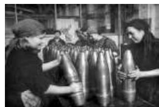
Работа на предприятиях