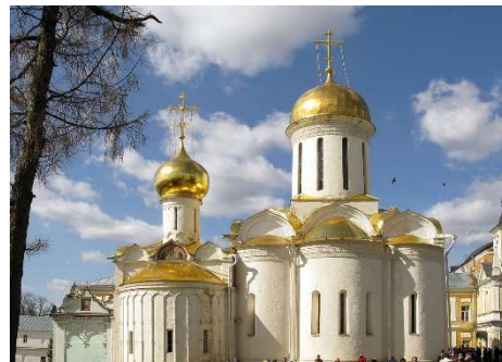
Рис.5 Свято-Троицкая Сергиева лавра

Белыми были рубахи, которые одевали воины перед битвой или военным походом. В белые узорчатые одежды наряжали невесту. Полотенца гостям подавали белые в знак того, что хозяева имеют по отношению к ним чистые помыслы, крестили младенцев в белых рубашечках и пеленали их в белые пеленки, чтобы уберечь от темного. Молодые девушки часто носили белые платки как символ непорочности [12]