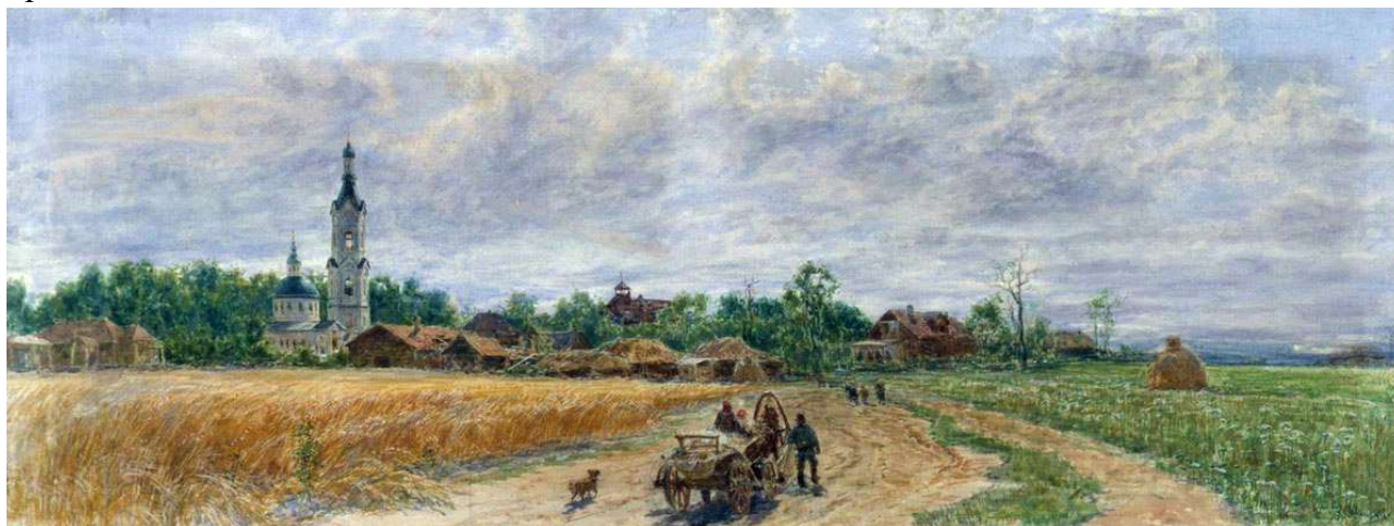
Рис. 4 К.А. Савицкий «Косино» (1897)

Или вспомним картину К.А. Савицкого «Косино» (рис.4): и золотые поля, и Успенский храм, и колокольня, и синие купола картины, и живое, дышащее простором небо на картине – все пронизано покоем и любовью к России.