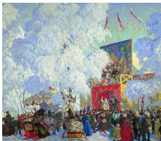
Рис.3 Кустодиев «Балаганы» (1917)