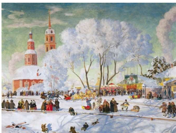
Рис.2 Б.М. Кустодиев «Масленица» (1920)

Подобные различия могут быть связаны в том числе с различной социокультурной практикой народов, цвет обогащается разнообразными ассоциациями, закрепленными в мировоззрении народа. Цвет в России во все времена имел важное значение. Уже в древней Руси были основные, главные цвета, которые несли большую смысловую нагрузку: красный, белый, синий, черный, золотой, зеленый. Именно такую цветовую палитру мы видим в «Слове о полку Игореве» или устном народном творчестве русского народа, в традициях иконописи и в шедеврах русских художников и народных мастеров.