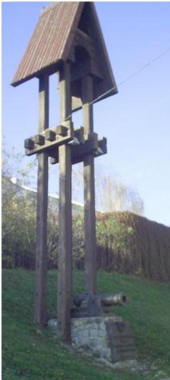
Звонница с мортирой на месте крепостной башни