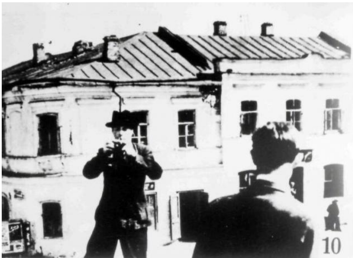
Пугачев в Пензе. Худ. Непьянов