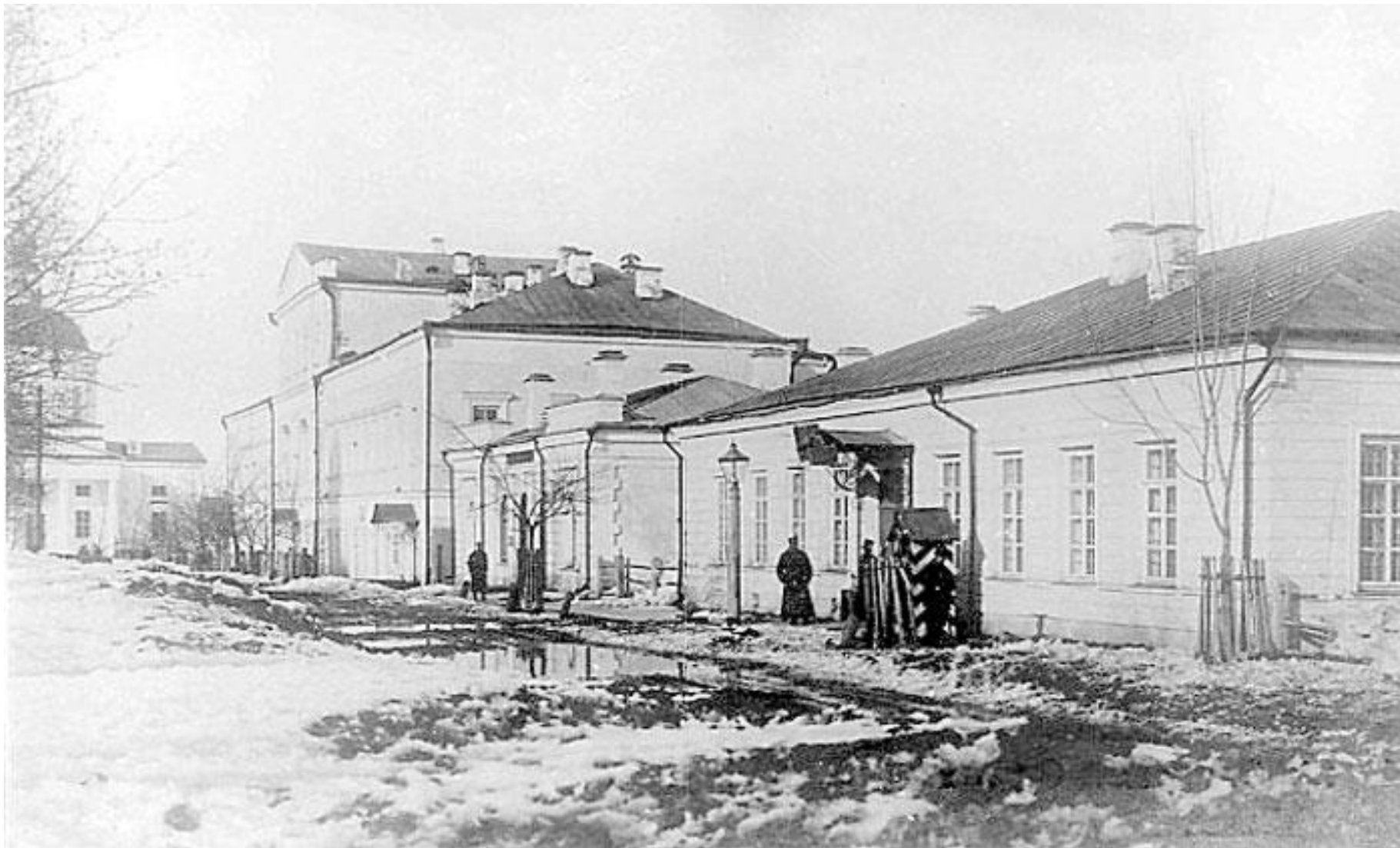
Ул. Белинского в 20 веке