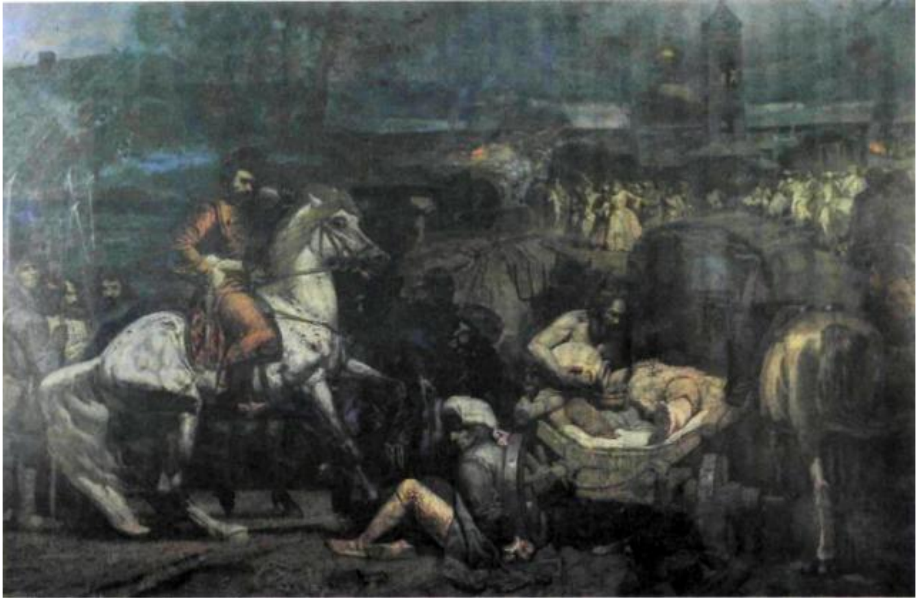
Уездное казначейство. Перед входом в здание находится караульная будка