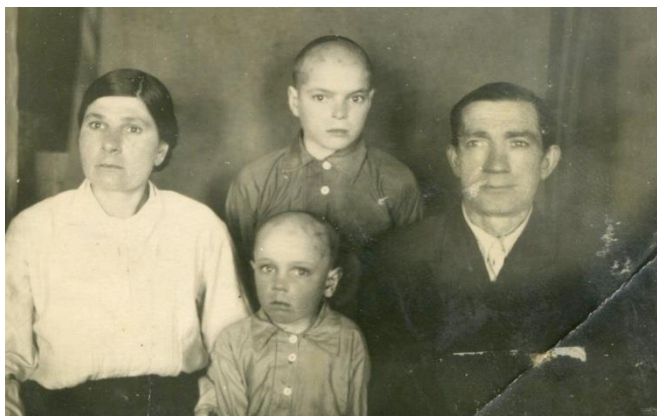
Рисунок 4. Семья Аксютиных

Ведь ни один праздник или просто вечерние посиделки не обходились без гармонистов Семёновых.