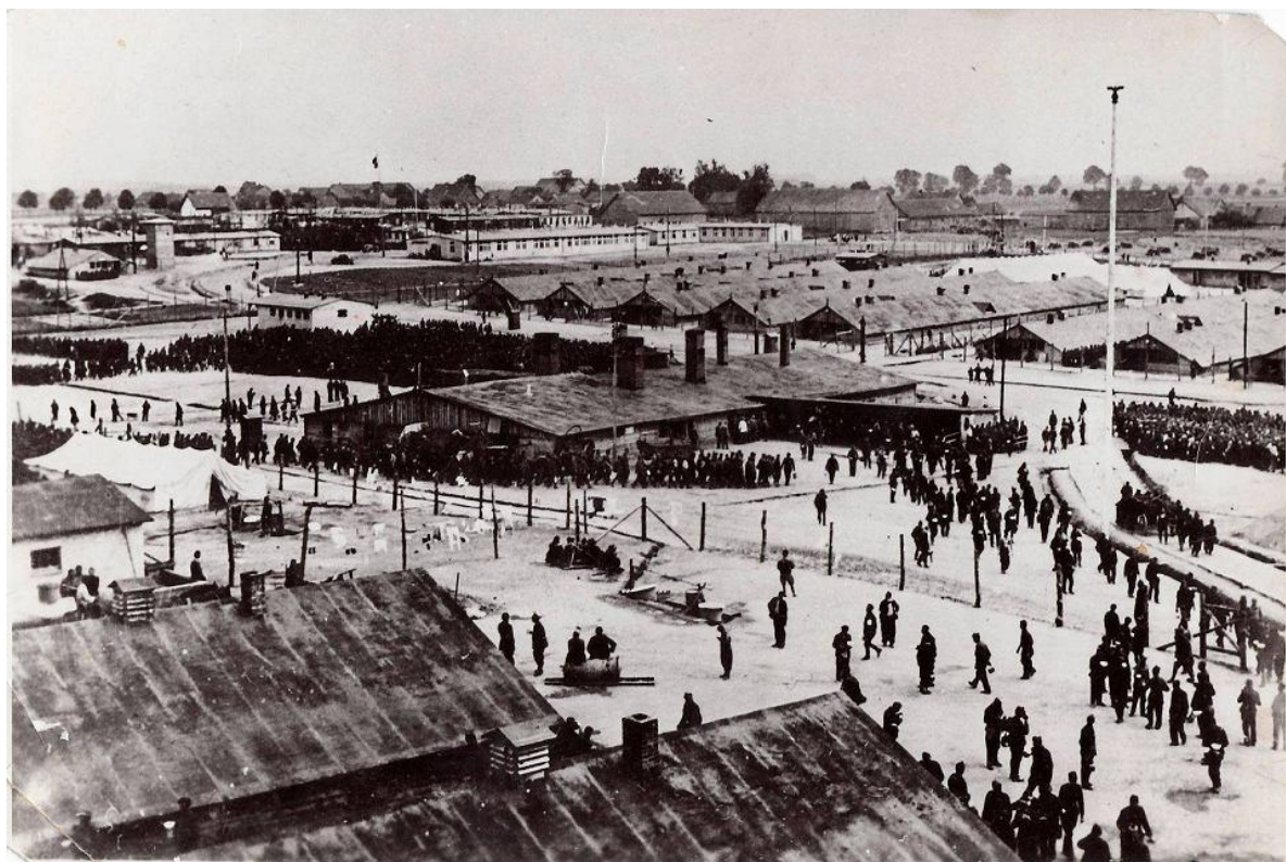
Фото лагеря для военнопленных Stalag 1В [6]