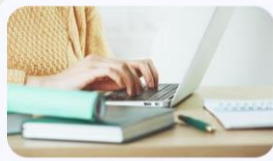
What are conditionals?