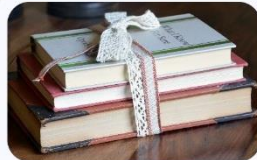
Second Conditional vs Third Conditional