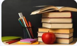
Zero conditional vs First conditional