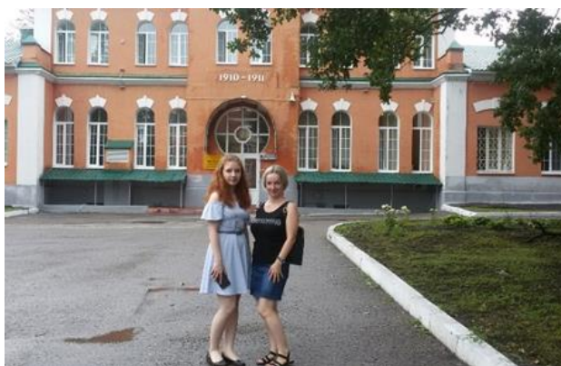
У Евграфовского корпуса