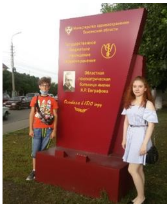
У входа в больницу