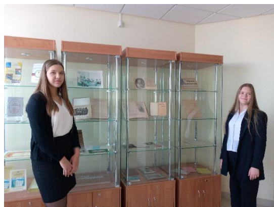
Экспозиция «Первая Лермонтовская» в зале Куприна