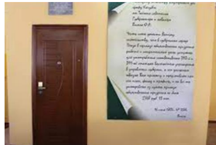
Вход в музей