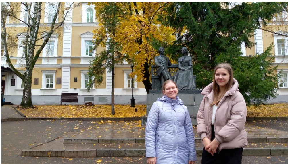
Здание МБОУ классической гимназии №1 имени В. Г. Белинского г.Пензы.

Посещение Музейного комплекса МБОУ классической гимназии №1 имени В. Г. Белинского г.Пензы.