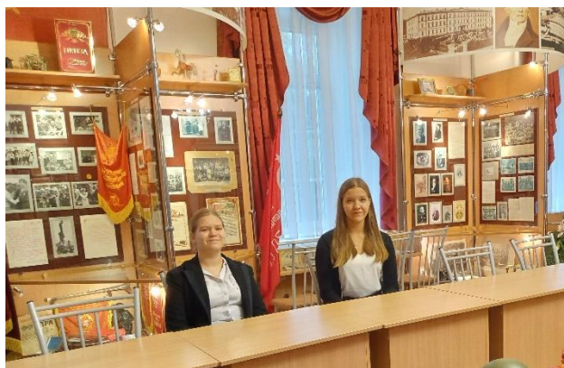
Музей истории гимназии