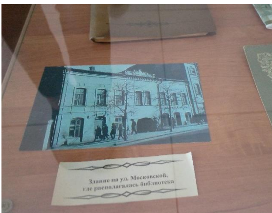
Первое здание библиотеки