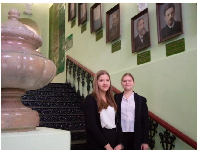
Портретная галерея в стенах гимназии

Посещение Пензенской областной библиотеки имени М.Ю. Лермонтова.