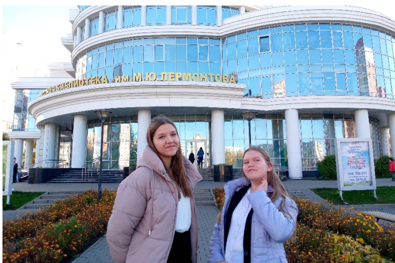
Здание Пензенской областной библиотеки имени М.Ю. Лермонтова

Посещение Пензенской областной библиотеки имени М.Ю. Лермонтова.