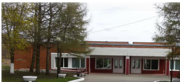
Здание, в котором расположен музей